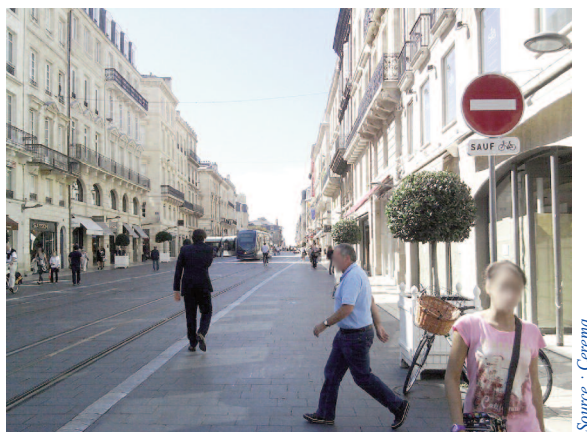
Double-sens cyclable en aire piétonne

Il est à noter que de nombreuses collectivités avaient anticipé cette disposition en instaurant le double-sens cyclable dans l'ensemble de leurs aires piétonnes.